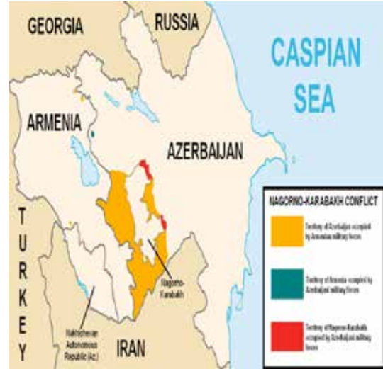
Bu harita sadece referans olarak alınmalı ve çatışmada her iki tarafın pozisyonunu baklı çıkarmak maksadı ile kullanılmamıştır.

rinden ambargo ve ablukayı delmesine ek olarak Azeri toprağı olan Naçhivan'a aynı şekilde ambargo ve abluka uygulamıştır. Ayrıca Azerbaycan'ın enerji kaynaklarından sağladığı gelir ile askeri, politik ve diplomatik alanda baskı unsuru olarak kullanması şu ana kadar istenen etkiyi sağlayamamıştır.